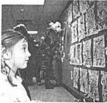
Une fois de plus cette année, les œuvres étaient variées et très créatives