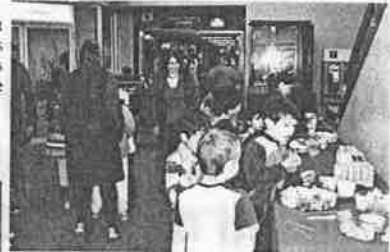
Un beau moment pour se rassembler entre amis et partager une collation