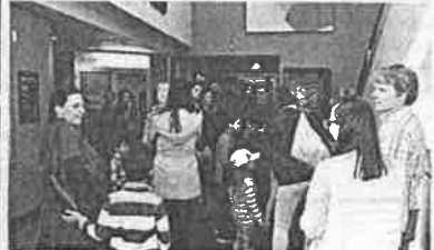
Une participation record cette année